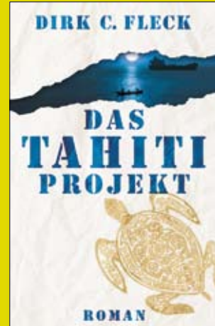
Ein packender Öko-Thriller der Extraklasse

Forum Nachhaltig Wirtschaften GEWINNSPIEL