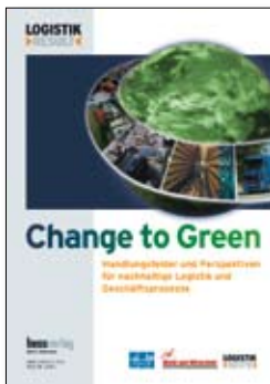
Change to Green Handlungsfelder und Perspektiven für nachhaltige Logistik und Geschäftsprozesse

2003, 352 Seiten, EUR 17,90 ISBN: 978-3-570-50032-3 www.riemann-verlag.de