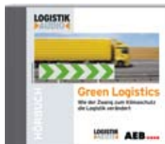
Green Logistics Wie der Zwang zum Klimaschutz die Logistik verändert

„Green Logistics“ zeigt erste erfolgreiche Ansätze und Konzepte anhand von Best-Practice-Beispielen und erläutert, wie sich beispielsweise der Carbon Footprint berechnen lässt oder wie Software dazu beitragen kann, die gesamte Supply Chain effizienter und umweltschonender zu gestalten. Unternehmen wie Boots, Nike oder Kuehne + Nagel berichten davon, wie sie es geschafft haben, ihre Supply Chain zu begrünen. Für CSR-Manager, die auf Augenhöhe mit ihren Logistikern sein wollen, ein Basishörbuch.