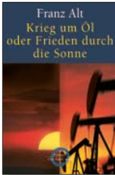
Franz Alt Krieg und Öl oder Frieden durch die Sonne

Heute ist der Energieverbrauch der Menschheit größer denn je. Eine Fortschreibung der gegenwärtigen Entwicklung würde jedoch zu weiterem Terror und noch größeren Umweltbelastungen führen. Nur wenn wir vom Öl wegkommen, wird sich das Klima verändern. Mit Hilfe von sanften Energien können wir aber auf eine friedliche Zukunft hoffen, so die These von Franz Alt.